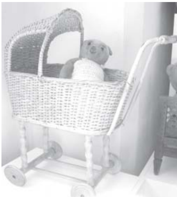
Proutěný kočárek pro panenky, kolem r. 1930.