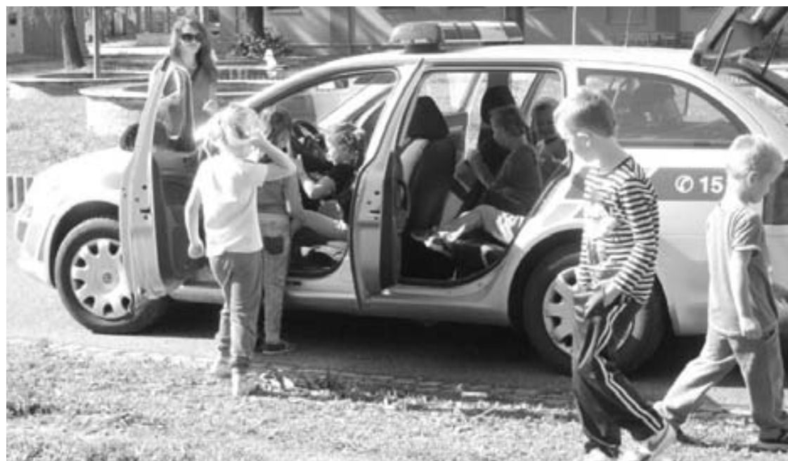
Už od školky se učí děti v Hodoníně dopravním předpisům. V rámci Týdne mobility se na cvičišti ukázalo v uplynulých dnech více než tři sta školčátek.