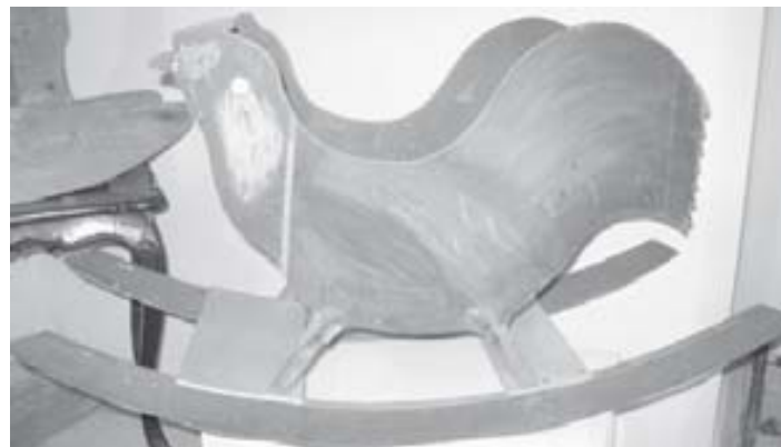
Houpací kohouty ručně malované zhotovil Alois Pollach, bývalý revírník ve Ždánicích.