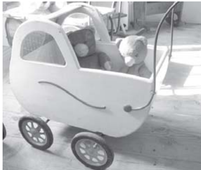
Dřevěný kočárek se skleněnými okýnký a shrnovací boudou.