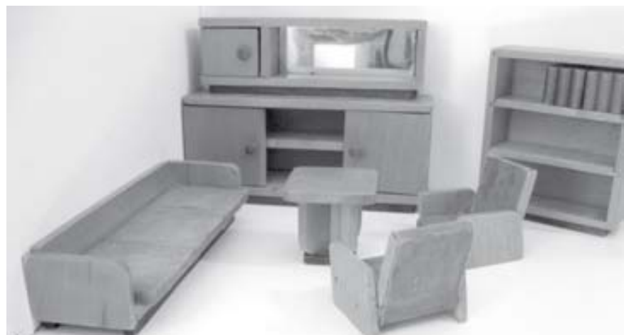
Pokojíček pro panenky z 50. let.

ŽDÁNICE – Ve Vrbasově muzeu ve Ždánicích je k vidění výstava historických hraček. Ty si muzeum půjčilo ze soukromých sbírek a ty nejstarší pocházejí z počátku 20. století.