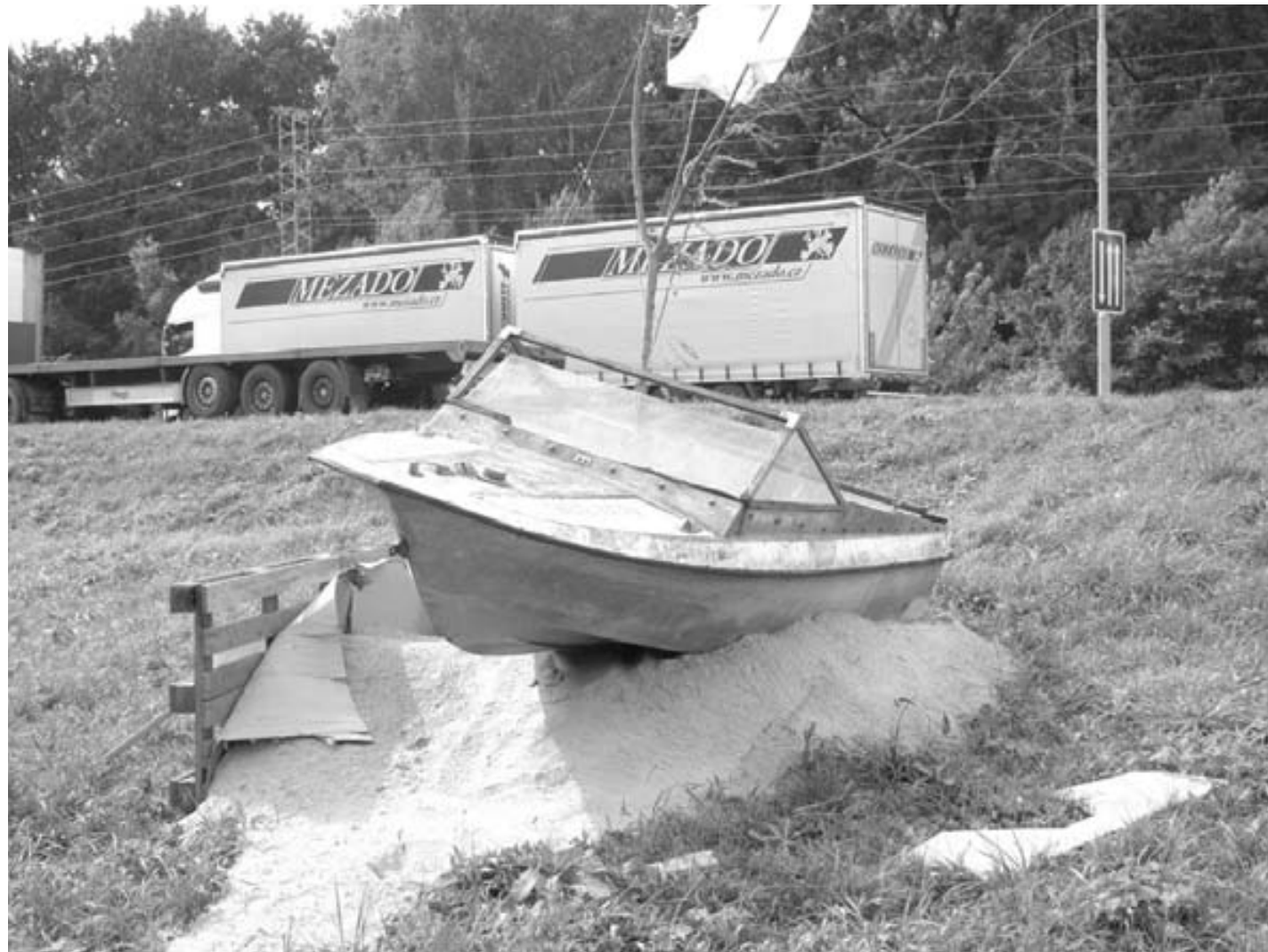
Člun je společnou instalací čtyř umělců z obou stran česko-slovenské hranice.

HODONÍN – V Galerii výtvarného umění, ale také přímo na bývalé celnici Hodonín-Holíč jsou k vidění díla projektu ARS 51. Právě název odkazuje na silnici a celnici, která je symbolem setkání obou stran – české a slovenské.