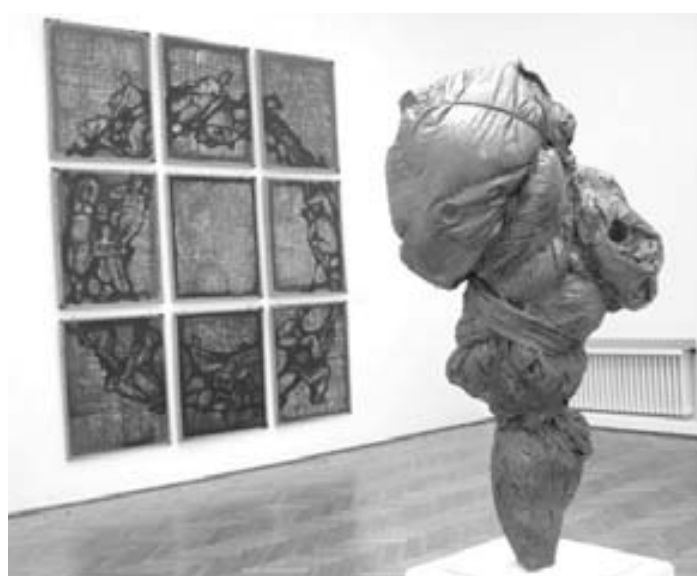
Tak vypadá existenciální tvorba Denisy Bogdalíkové.